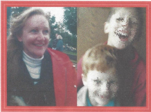
Letzte Aufnahme von den Kindern aus dem Jahr 1997.

Nach der Trennung von meinem Ex-Mann habe ich den Kontakt zu meinen beiden Söhnen trotz Sorgerecht komplett verloren. Weder ich noch die von mir um Hilfe gebetenen Hilfsorganisationen wie Jugendamt, evangelische und katholische Kirche, Diakonie, Suchdienste u.a. konnten eine Brücke zwischen mir und meinen Kindern aufbauen.